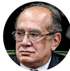
EVARISTO SAIAFP PHOTO