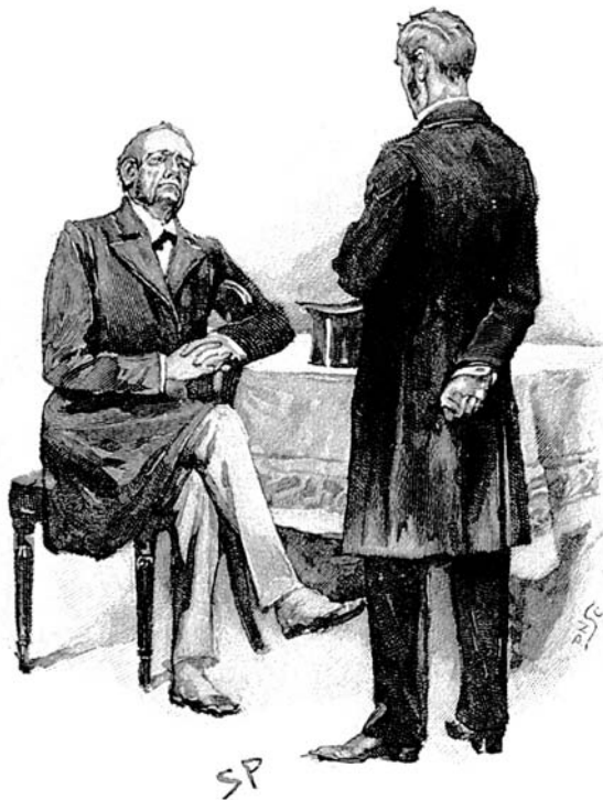
“Encarei-o, espantadíssimo.” [Sidney Paget, Strand Magazine , 1893]

“Essa foi a estranha proposta, Mr. Holmes, com que esse Blessington se aproximou de mim. Não vou aborrecê-lo com o relato da negociação. O resultado foi que me mudei para a casa no Lady Day, 10 e comecei a clinicar nas condições que ele havia sugerido. Ele