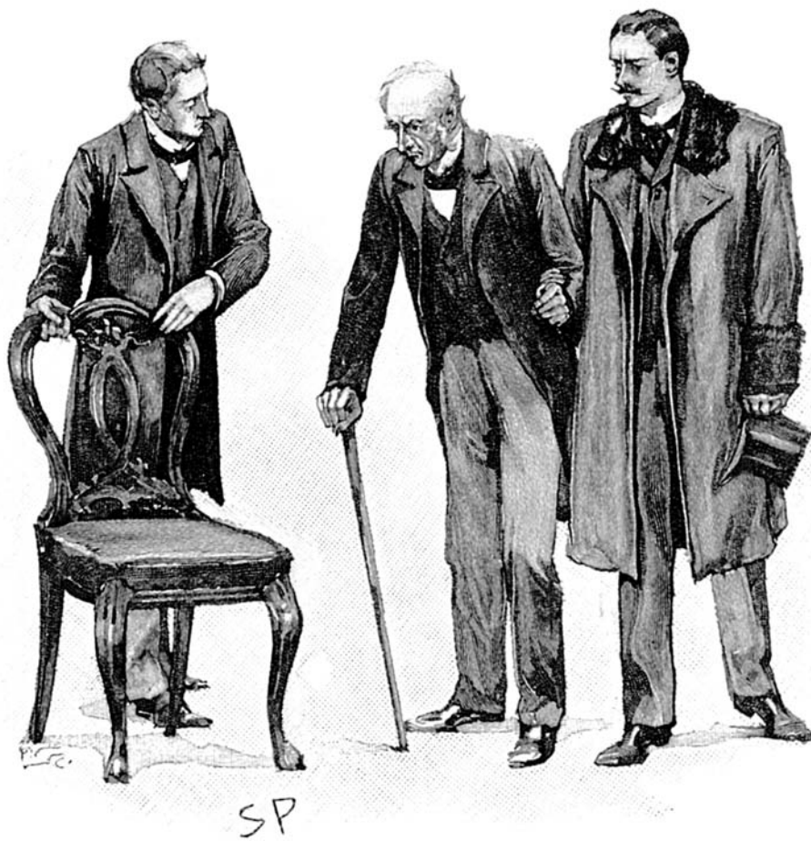
“Ajudou-o a se sentar.” [Sidney Paget, Strand Magazine , 1893]

“Por nada neste mundo’, exclamou com um gesto de horror. ‘Isso é mais penoso para mim do que posso expressar. Se tivesse de ver meu pai num desses aflitivos ataques, estou convencido de que não sobreviveria. Meu próprio sistema nervoso é excepcionalmente sensível. Com sua permissão, ficarei na sala de espera enquanto o senhor examina o caso de meu pai.’