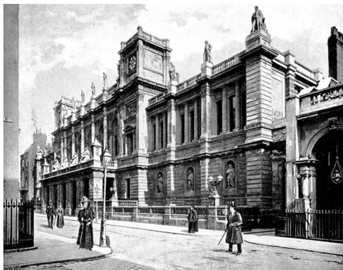
Universidade de Londres [The Queen's London, 1897]

9. A Cavendish Square e a área circundante, em especial Harley e Wimpole Streets, eram conhecidas por abrigar os consultórios de alguns dos mais exclusivos médicos de Londres. Na obra de Robert Louis Stevenson, O estranho caso do Dr. Jekyll e Mr. Hide (1886), o dr. Lanyon, um amigo e colega do dr. Jekyll, morava e atendia pacientes na “Cavendish Square, aquela cidadela da medicina”. Florence Nightingale trabalhou como superintendente do Institute of Sick Governesses após a transferência deste para Harley Street em 1853; a Royal Society of Medicine tem sede em Wim-